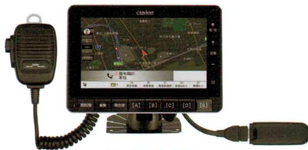
Solid-IP ソリッド アイビー