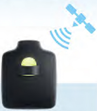
GPS内蔵ETCアンテナ (幅28mm×高さ16mm×奥行き35mm)

ナビがなくても、 スマホがなくても大丈夫! この一台でETC2.0サービス がご利用いただけます。