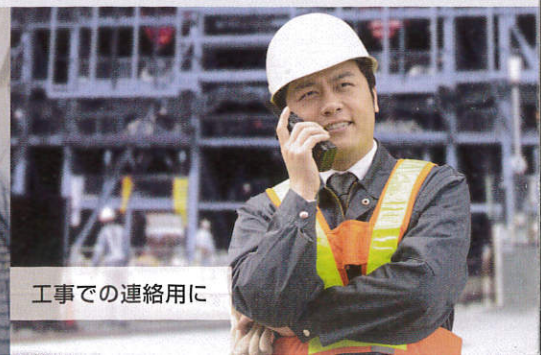
工事での連絡用に