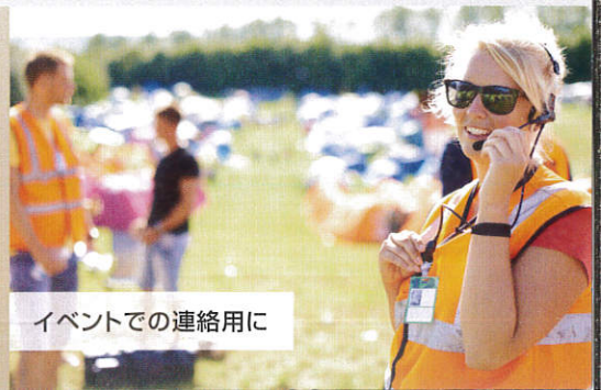
イベントでの連絡用に