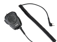
大音量防水スピーカーマイク MP68 (IP67*相当 防水・防塵性能、 スピーカー出力2W 3.5φイヤホン端子付き)