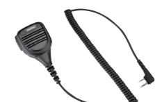
大音量スピーカーマイク MP16 (IP54*相当 防水・防塵性能、 スピーカー出力2W 3.5φイヤホン端子付き)