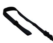
ネック ストラップ SK-T03