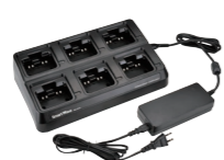
6連急速充電器 (ACアダプタ付) SK-P04