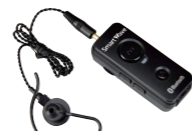
Bluetooth® イヤホンマイク SK-M03