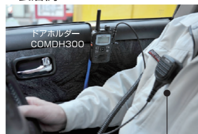
大音量スピーカーマイク MP16