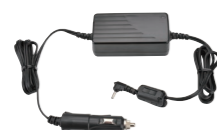
車載用 シガライター ケーブル SK-P07