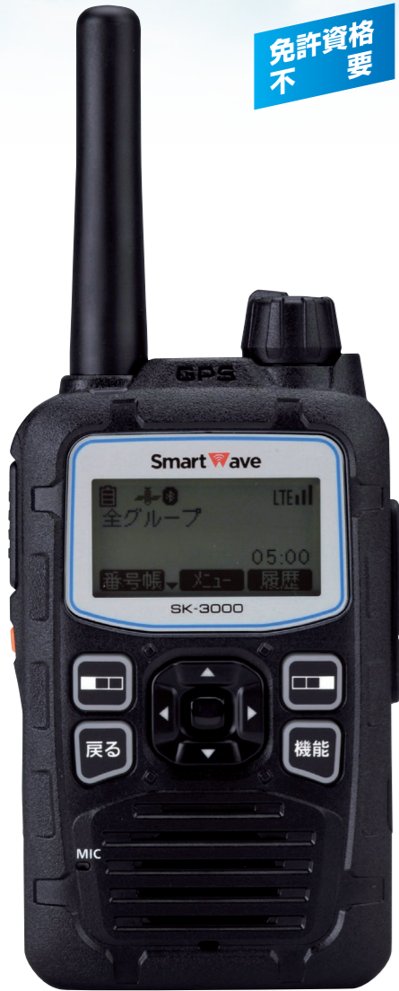
実寸大 重量 約250g (アンテナ、Li-ionバッテリーパック装着時)